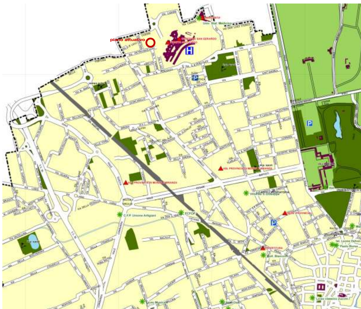
Estratto stradario comunale

L'area è caratterizzata quindi da buoni livelli di accessibilità sia alla viabilità di quartiere che alla viabilità primaria.