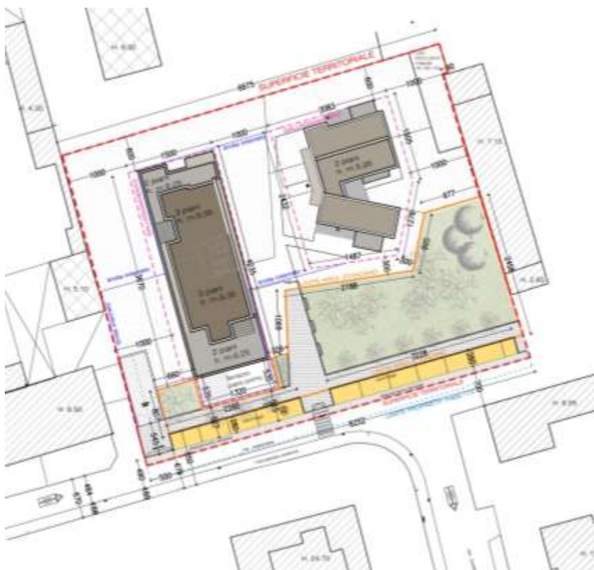
Planivolumetrico di progetto

Non si prevedono nuove necessità di parcheggi oltre quelli esistenti e in progetto