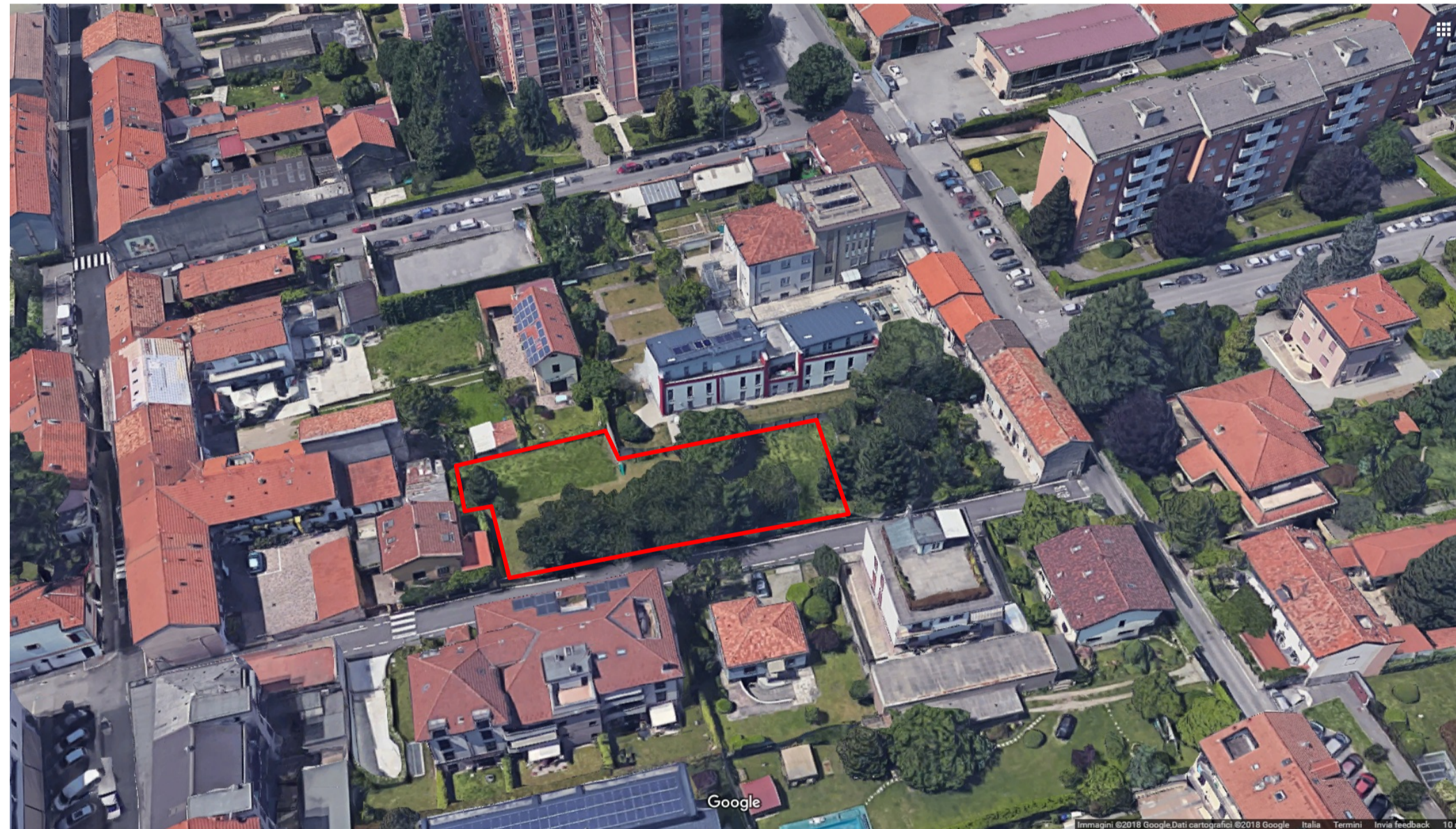
Vista satellitare - 3D