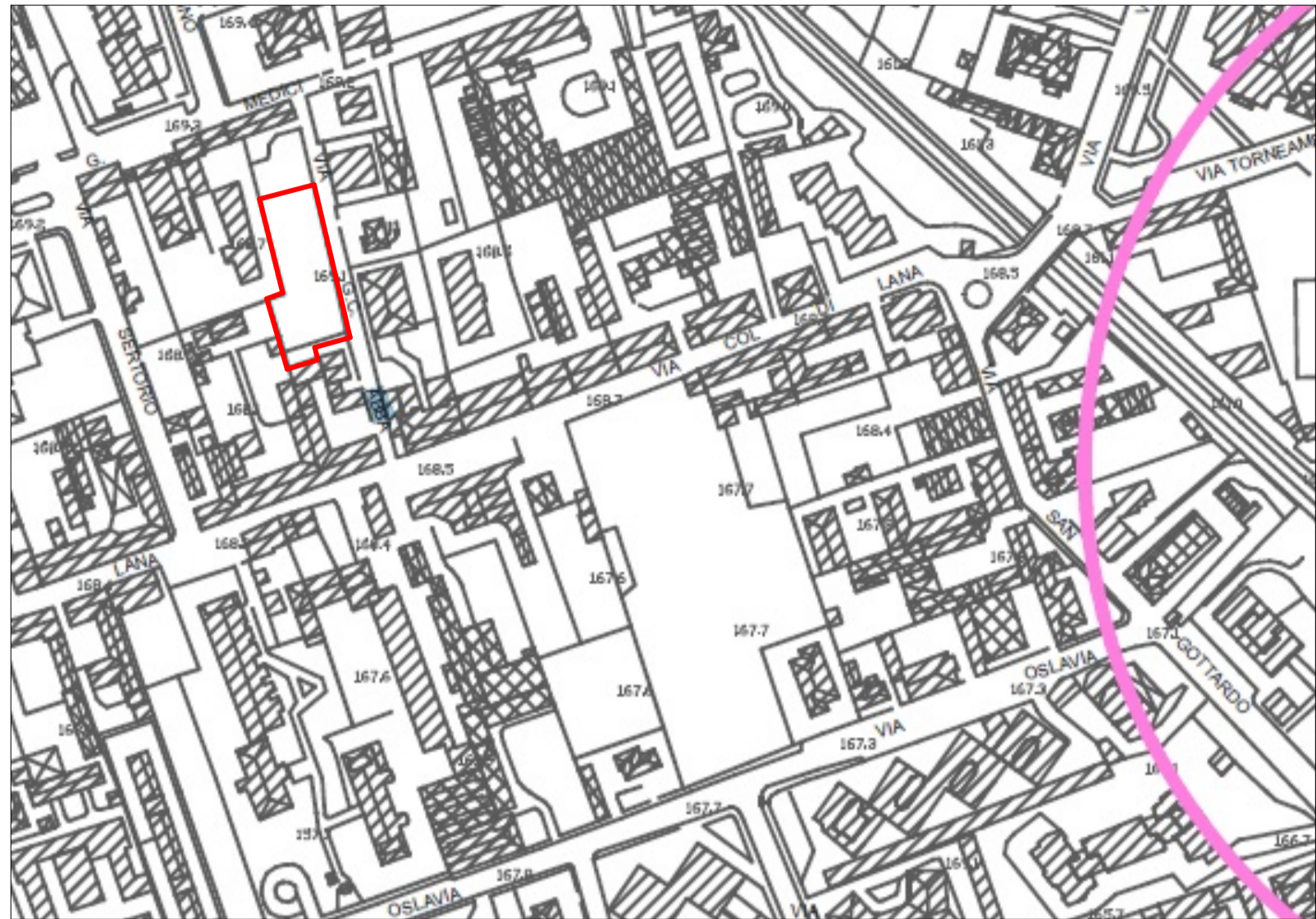
Componente Geologica, Idrogeologica e Sismica - carta dei vincoli