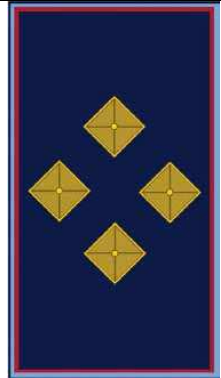
TABELLA DISTINTIVI DI GRADO e DENOMINAZIONI APPROVATI DAL REGOLAMENTO REGIONALE n. 2 del 13/7/2004

Compete al Comandante Dirigente, con proprio provvedimento, riconoscere al personale il “distintivo di grado”, entro 30 giorni gli uffici competenti provvederanno ad aggiornare i relativi profili professionali.