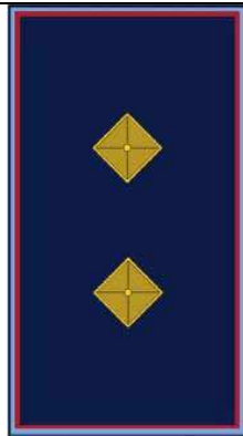
TABELLA DISTINTIVI DI GRADO e DENOMINAZIONI APPROVATI DAL REGOLAMENTO REGIONALE n. 2 del 13/7/2004

Compete al Comandante Dirigente, con proprio provvedimento, riconoscere al personale il “distintivo di grado”, entro 30 giorni gli uffici competenti provvederanno ad aggiornare i relativi profili professionali.