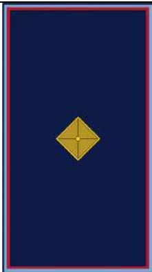
TABELLA DISTINTIVI DI GRADO e DENOMINAZIONI APPROVATI DAL REGOLAMENTO REGIONALE n. 2 del 13/7/2004

Compete al Comandante Dirigente, con proprio provvedimento, riconoscere al personale il “distintivo di grado”, entro 30 giorni gli uffici competenti provvederanno ad aggiornare i relativi profili professionali.