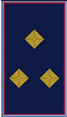
TABELLA DISTINTIVI DI GRADO e DENOMINAZIONI APPROVATI DAL REGOLAMENTO REGIONALE n. 2 del 13/7/2004

Compete al Comandante Dirigente, con proprio provvedimento, riconoscere al personale il “distintivo di grado”, entro 30 giorni gli uffici competenti provvederanno ad aggiornare i relativi profili professionali.